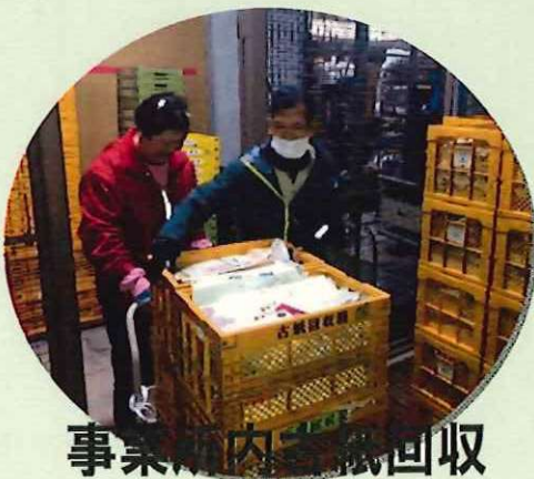
事業所内ごみ回収

1日5時間労働で、月平均で工賃は4万円を超えています。また、作業を通して“労働者”としての意識・技能を身につけ、長期的なスパンで一般就労にステップアップすることも大切にしています。多種多様な作業を提供できるので、経験の幅が広がり、必ず自分に合った作業が見つかります。