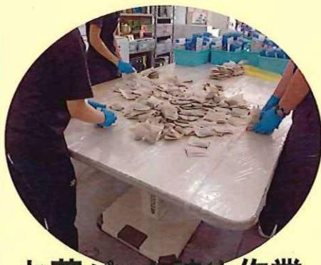
お茶パッケージ詰め作業