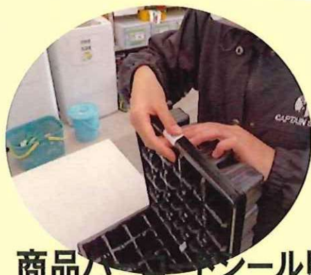
商品パッケージラベル貼り