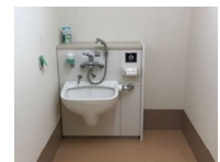
オストメイト対応