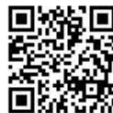
携帯電話用QRコード

姫路市公共施設予約システムを利用して、インターネットから 仮予約 ができます。予約システムの利用にあたっては、事前に障害者体育館などで利用登録をする必要があります。 ※ルネス花北での受付開始日から3日(土日祝を除く)遅れてインターネットからの 仮予約 ができます。